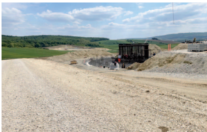
Aktuelles Beispiel: Windkraftanlagenbau in Gnadendorf mit großflächiger Zerstörung von Landschaft und Natur

Der Rückbau sowie die Entsorgung von Windkraftanlagen sind unklar und hochproblematisch! Am Ende bleiben womöglich die Eigentümer und die Kommunen auf den Altlasten sitzen!