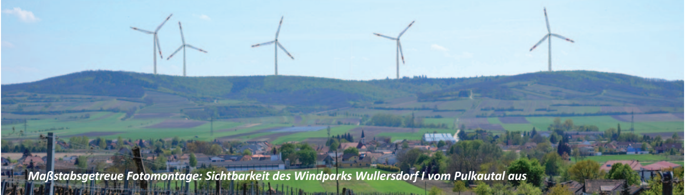
Maßstabsgetreue Fotomontage: Sichtbarkeit des Windparks Wullersdorf I vom Pulkautal aus

Laut dem Windatlas Österreich liegt das Windaufkommen im Pulkautal mit \varnothing 4 - 5 m/Sek. im unteren Bereich der Mindestanforderung für den Bau von Windkraftanlagen! Keine ideale Voraussetzung für diesen Standort!