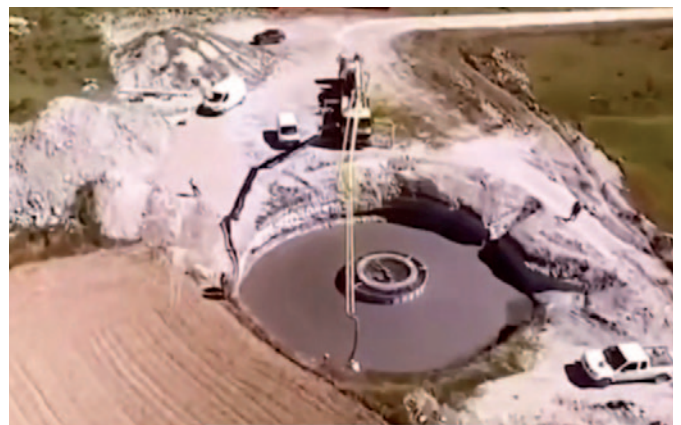
Rund 2 Hektar Fläche werden für den Bau eines Windrads auf dem Buchberg zerstört, also 10 Hektar insgesamt

Sollte der Windpark Wullersdorf I beim Bundesverwaltungsgericht genehmigt werden, ist damit zu rechnen, dass sowohl auf dem Buchberg, in Kalladorf und auf dem nördlichen Höhenzug des Pulkautals weitere Windkraftanlagen folgen! Wir reden dann von bis zu 60 Windrädern. Das hat nicht nur negative Auswirkungen auf die Umwelt, die Lebensqualität und den Freizeitwert der Region, sondern auch auf die Immobilienwerte. Häuser und Grundstücke verlieren ihre Attraktivität und sinken im Wert! Es ist außerdem damit zu rechnen, dass Zweitwohnsitzer ihre Immobilie wieder verkaufen, weil der Hauptgrund für eine Ferienimmobilie, nämlich die reizvolle Landschaft, entfällt! Die Folge ist eine gefährliche Abwärtsspirale auch für Handel, Gastronomie, Gastgeber und Handwerk.